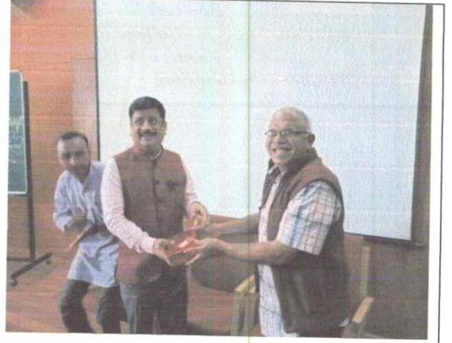
ಪ್ರಾಂಶುಪಾಲರಿಗೆ ವಿಭಾಗದ ಮುಖ್ಯಸ್ಥರಿಂದ ನೆನಪಿನ ಕಾಣಿಕೆ