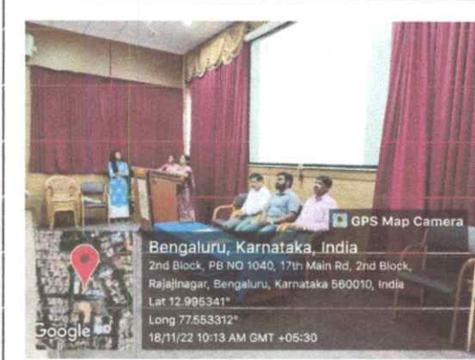
ಸ್ವಾಗತ ನೀತೆಯನ್ನು ಹಾಡುತ್ತಿರುವುದು