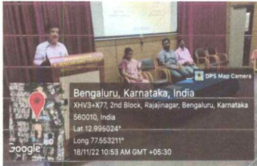
ಕಾರ್ಯಕ್ರಮದ ಕುರಿತು ಪ್ರಾಂಶುಪಾಲರ ನುಡಿಗಳು