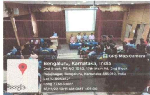
ಮುಖ್ಯ ಅತಿಥಿಗಳ ನುಡಿಗಳು

Head of the Kannada Dept. KLE Society's S. Nijalingappa College II Block, Rajajinagar, Bangalore-560 010