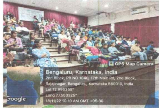
ಕಾರ್ಯಕ್ರಮಕ್ಕೆ ನೆರೆದ ವಿದ್ಯಾರ್ಥಿ ಸಮೂಹ