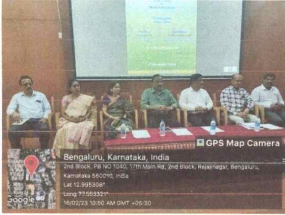
Resource persons with Languages HODs