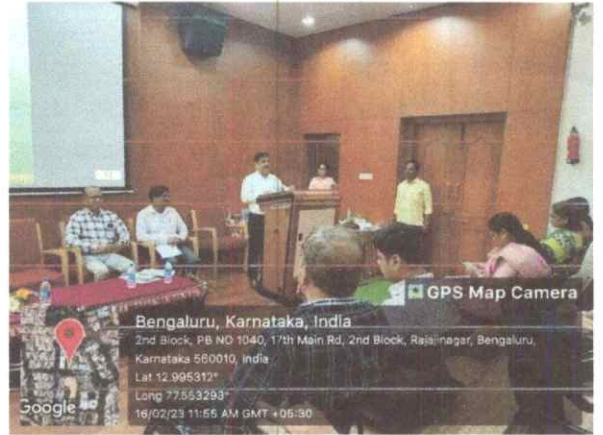
Presidential remarks by Principal