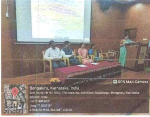
ಅತಿಥಿಗಳು ಮತ್ತು ಕಾರ್ಯಕ್ರಮದ ನಿರ್ವಹಣೆ