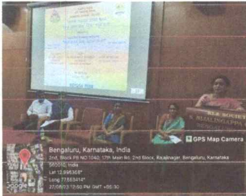
ಅತಿಥಿಗಳು ಕಾರ್ಯಕ್ರಮವನ್ನು ದ್ವೇಶಿಸಿ ಮಾತನಾಡುತ್ತಿರುವುದು