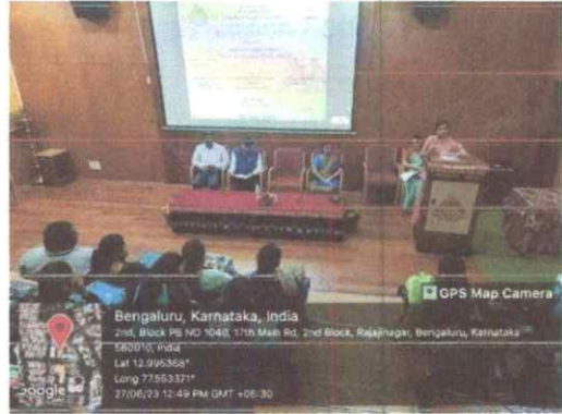
ಅತಿಥಿಗಳು ಕಾರ್ಯಕ್ರಮವನ್ನು ದ್ವೇಶಿಸಿ ಮಾತನಾಡುತ್ತಿರುವುದು