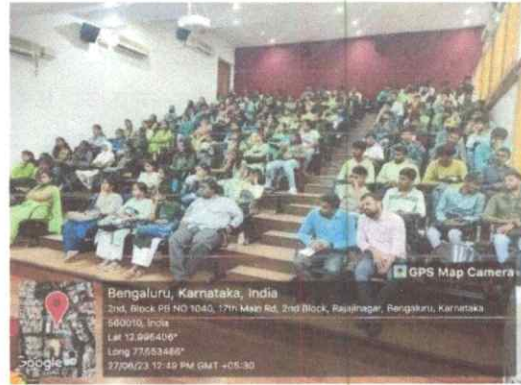
ವಿದ್ಯಾರ್ಥಿಗಳು, ಪ್ರಾಧ್ಯಾಪಕರುಗಳು ಅತಿಥಿಗಳ ಮಾತನ್ನು ಕೇಳುತ್ತಿರುವುದು